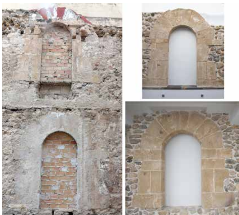
FIGURA 4. Fotogrametria del mur amb les troballes realitzades i arcs restaurats amb marques de pedrapiquer.

per a la construcció de la tàpia, però considerem que això cal ficar-ho en relació amb el us no merament militar de l'edifici, sinó també de prestigi, per la qual cosa es cuidarien els detalls d'acabat dels paraments i aquests es taparien i lluirien, per oferir la imatge d'un mur continu (color groc). A les descripcions de l'estat d'abandonament previ a l'època dels Bonastre (així com a les del segle XVII), es fa notar que hi han murs fets de tàpia de terra i de terra costrada que es troben fetes molt malbé pel propi tipus d'obra emprada, la qual cosa ens fa pensar que este mur que s'ha tret a la vista no és alçat en el primer moment de construcció del palau (al qual si que correspondrien els murs de tàpia de terra costrada que encara romandrien inconnexes pel conjunt del palau fins el seu abandonament