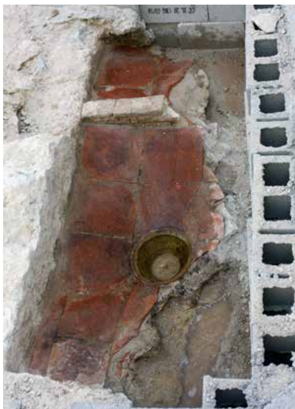
FIGURA 5. Estructures contemporànies.

tura o reforma de dos envans realitzats en arc de mig punt i dovelles de pedra picada, amb marques de picapedrer amb forma de fletxa. Estes obres es durien a terme ja baix la senyoria dels Cardona a inicis del segle XVI (Seser, 2010).