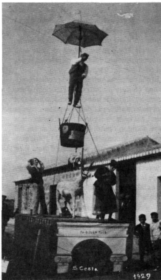
Una de les primeres falles plantades a Dénia: any 1929.

ficat el lema de "Ja volen tots". Apareixia, segons la fotografia que hem pogut contemplar, un home ascendint agarrat a un paraigües obert, mentre baix s'observava un burro arrastrat per una dona, potser ironitzant sobre allò que s'ha dit sempre de que ens volen fer creure que un burro vola", o referint-se al tema de l'aeronàutica, tant de moda per aquells temps d'ascensió en globus, del "Graff Zepelin", el vol del "Plus Ultra", etc.- A eixa interpretació personal de l'autor d'aquest treball sobre el sentit de la falla, podria afegir-se-li o anteposar-li la versió que estima que l'home que apareix dalt simbolitza-