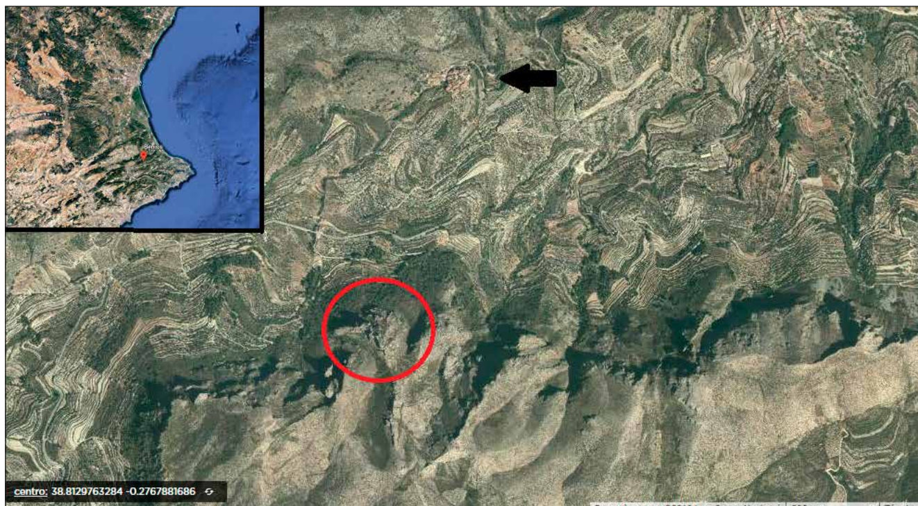
Figura 1. Plànol de localització del castell d'Alcalà (cercle roig) i el nucli de població de Benissili (fletxa negra).

Es tracta d'un conjunt fortificat de dimensions considerables (fig. 2). Es pot dividir en almenys dos recintes ben diferenciats, bastits mitjançant la tècnica de la tàpia, amb reformes efectuades amb maçoneria i alguns punts en què es va emprar pedra tallada. El que es troba a major altura és el que es considera la cellduïa o alcassaba, aquell recinte