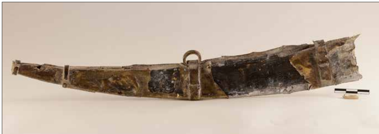
Figura 7. Beina de la donació del castell d'Alcalà.

baixmedievals, s'aprecia un pom circular, mànec lleugerament cònic i llarg, i guarnició recta. La resta de l'espai es troba decorat amb línies i composicions geomètriques.