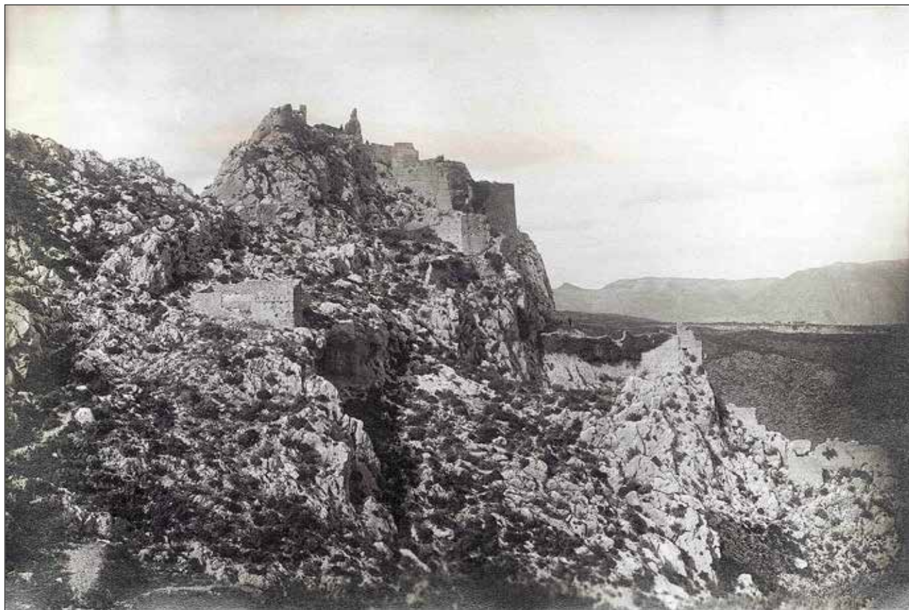
Figura 3a. El castell d'Alcalà als anys 1920.