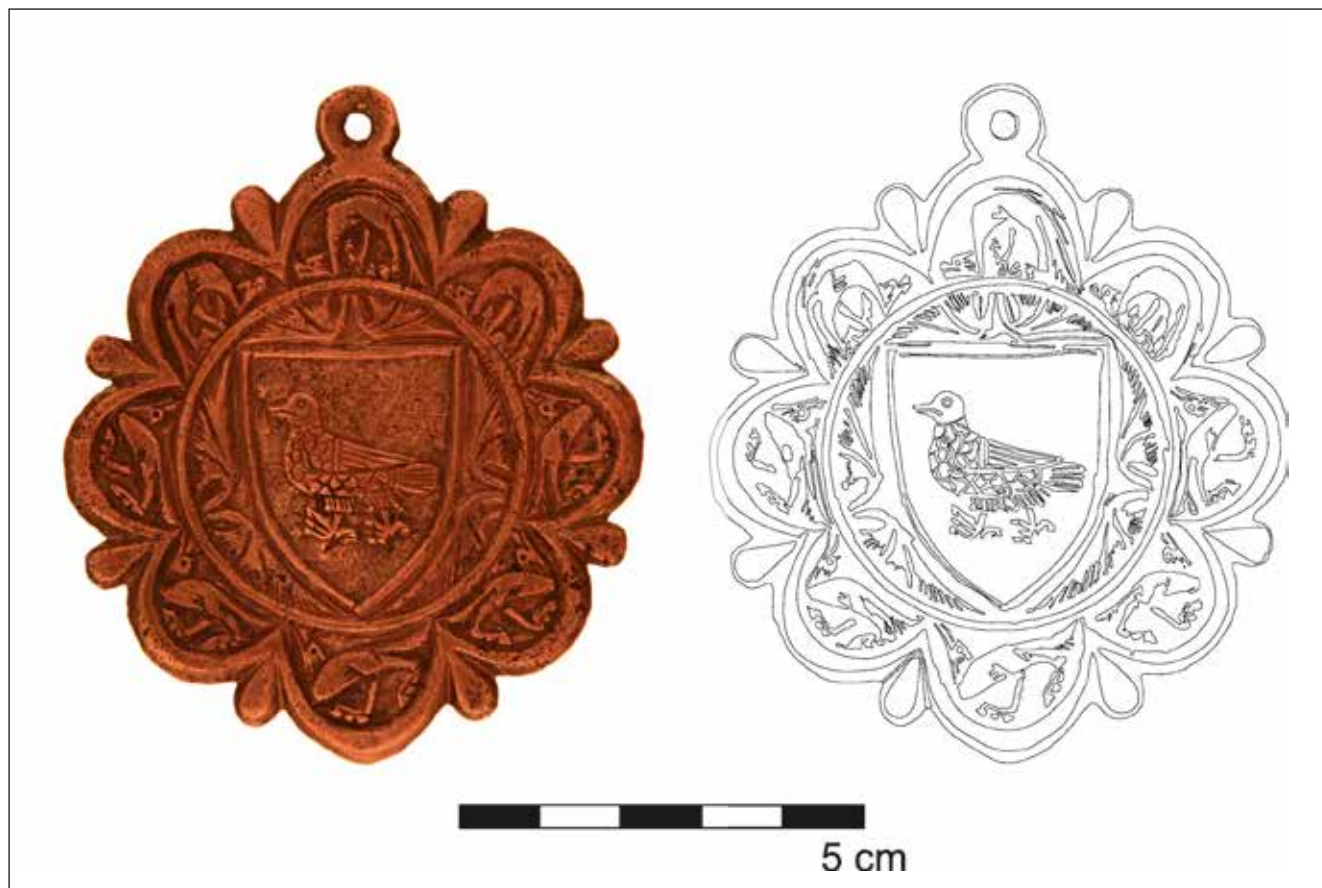
Figura 5. Fotografia i dibuix del penjant del castell d'Alcalà.

pietari, juntament amb un lot interessant de ceràmica baixmedieval cristiana vidrada i decorada, seleccionada a consciència (només hi trobem vores i solers decorats en verd i manganés, blau cobalt, blau i daurat o reflex metàl·lic, o simplement amb coberta estannífera, i fragments informes igualment decorats). També s'hi ingressaren algunes peces metàl·liques que comentarem més endavant.