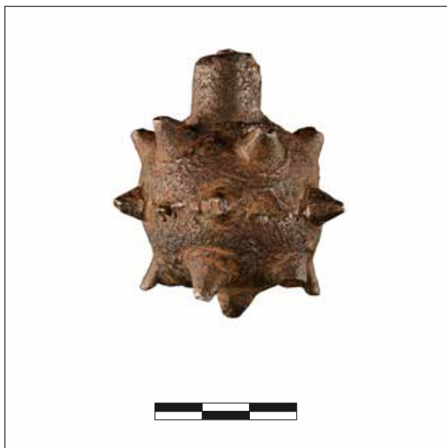
Figura 6. Cap de maça de cadenes, de la donació del castell d'Alcalà.