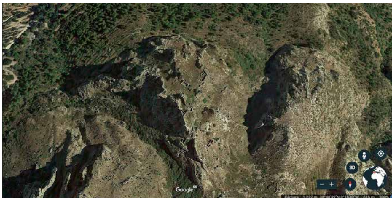
Figura 2. Vista aèria del castell d'Alcalà.

en què es devien trobar les dependències directament relacionades amb el poder; presenta una planta més o menys trapezoïdal, amb una certa tendència triangular, i es localitza en la part més escarpada del cim de la muntanya, sobre les dues crestes de roca, ben defensat per l'abrupte pendent d'accés, tancat per llenços de muralla i una porta en colze, i