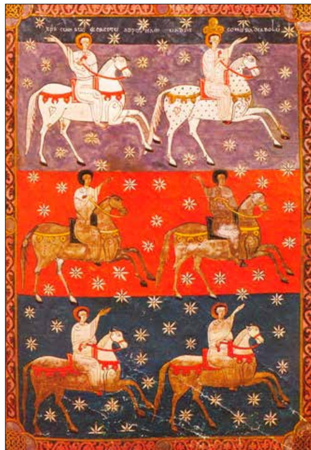
Figura 4. Miniatura del Comentari a l'Apocalipsi de Beat de Lièbana, amb els cavalls ornamentats amb penjants de diverses formes.

A partir d'aquell moment, el castell d'Alcalà aniria oscil·lant entre diversos gestors, sempre sota la propietat reial, fins l'any 1288 (Bazzana, Cressier i Guichard, 1982: 284). En aquell any, el dia 27 d'agost, el rei Alfons II faria donació del castell a Bernat Guillem de Vilafranca, cavaller rossellonés, per les pèrdues que havia patit durant la guerra contra França que s'havia desenvolupat durant els últims dos anys de vida del seu pare Pere el Gran. Des d'aquest