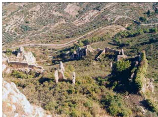
Figura 3c. Vista parcial de l'interior del Castell d'Alcalà.

per la caiguda vertical de les parets de la formació rocallosa per la resta de punts. La seua morfologia resulta complicada, a causa de l'adaptació a l'orografia del lloc (fig. 3).