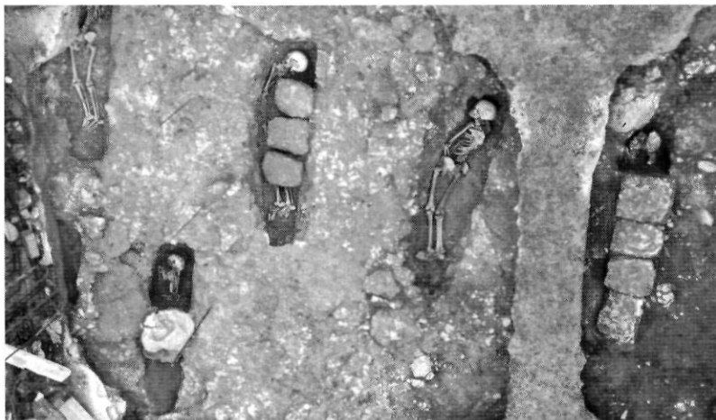
foto 1. Vista aèria del solar excavat.

Però la troballa, no va ser massa sorpresa, sobretot per als veïns del carrer la Bassa i del carrer Xaló, que moltes voltes, i des de sempre, al fer qualsevol forat, i no calia molt fondo, bé per fer fonaments, bé per fer xanques per a conduccions, pous, etc, es trobaven amb el ossos d'algun "moro"..., no sabien massa bé el que era, però tampoc els preocupava, i no li donaven massa importància, malgrat ser restes humanes.