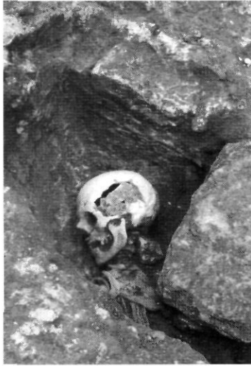
foto 4. Detall de la capçalera d'una sepultura.

Es tracta d'un trosset del Cementeri de les persones que vivien en un xicotet grupet de casetes, a penes unes 50 al final del període. Possiblement devien estar en el cuny que es forma entre el riu Gorgos i el barranquet de les Bolerias, i que té una entitat i que anomenem Gata. Possiblement va aparèixer amb les necessitats de proveïment de productes agrícoles a Dénia i el seu Port, que durant aquesta època va adquirir el seu màxim esplendor i apogeu. De les cases, de la seua localització i distribució, no sabem encara res. De quina raça són, com eren, de quina esperança de vida disposaven, de què s'alimentaven, quines malalties patien, de què morien, quines activitats realitzaven, tot açò i altres coses més ens ho diran els estudis antropològics dels esquelets recuperats amb el mètode arqueològic.