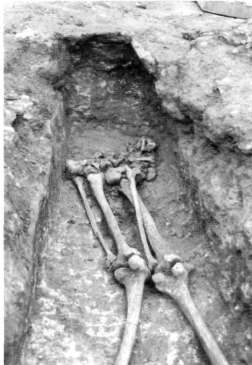
foto 5. Detall de la part dels peus d'una tomba.

Encara falten moltes incògnites per resoldre, i molt d'estudi que completar, fins ara es coneix molt bé la genealogia dels "propietaris", i no res dels que deixaren la suor de la seua vida en la construcció d'un espai habitable en aquest racó del món. Aquest és l'arxiu on es guarden les primeres planes de la Història del poble, de les persones que en esta terra han viscut i que han fet Gata.