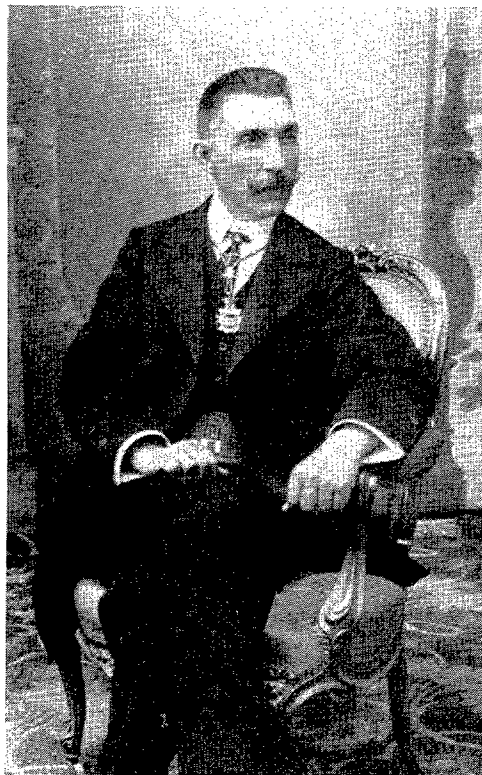
Celestino Pons Albi, President de la Diputació Provincial d'Alacant.

Raventós, diputat per Dénia des de 1916 a 1923; la presència a Pego -on, fins i tot, se'l nomena algun any per l'article 29- de Miguel Maura Gamazo, fill d'Antonio Maura