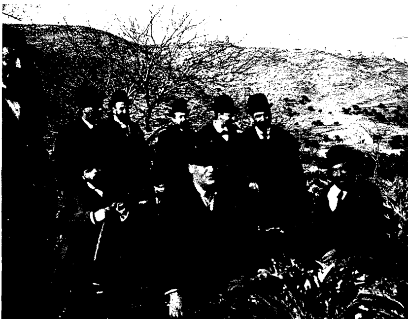
Càcics a Xàbia. Començament segle XX.

consentir els partidaris d'Orduña per " tradicció, justícia y ètica ":