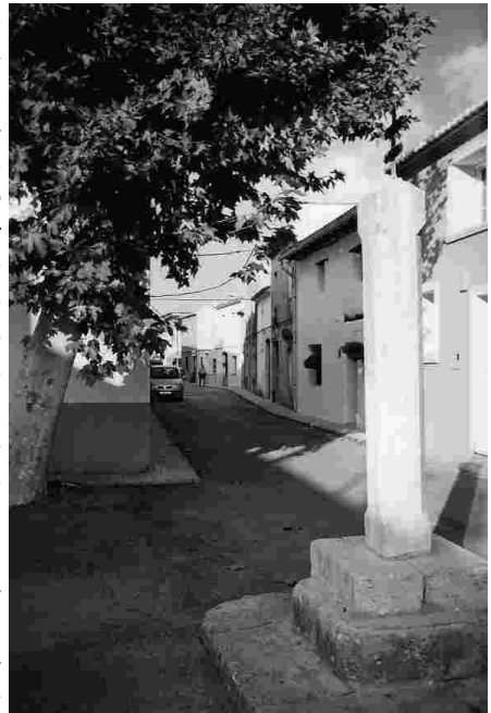
Lloc de Pamis