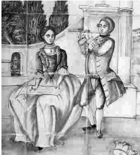
Nobles valencians S. XVIII