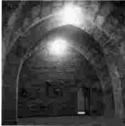
Presor del Castell de Xàtiva

La seua presó no va haver de prolongar-se, no obstant, durant molt de temps. De nou en 1680 sol·licitava al monarca que l'excusara de la visita, en aquest cas " por haber estado algún tiempo suspenso de su ejecución (de l'ofici) por la causa que es tan notoria " 7 . Però, contràriament al que poguera pensar-se, el motiu a què es refereix no va ser el temps que va romandre a la presó sinó el fet d'haver-se vist involucrat en el que Sebastián García va qualificar com l'" affaire " del bandit eclesiàstic. Es tractava de l'execució sumària, en la nit de l'11 al 12 de setembre, de Pedro Antonio Ribera, àlies " lo frare ", subdiaca de l'orde de Sant Agustí -ignorant tant la legislació foral com la jurisdicció de l'Església-, per orde del virrei, duc de Veragua, a fi d'una pretesa, encara que dubtosa, exemplaritat.