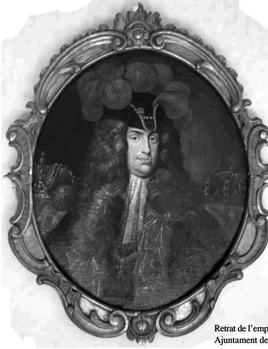
Retrat de l'emperador Carles VI. Ajuntament de Dénia.