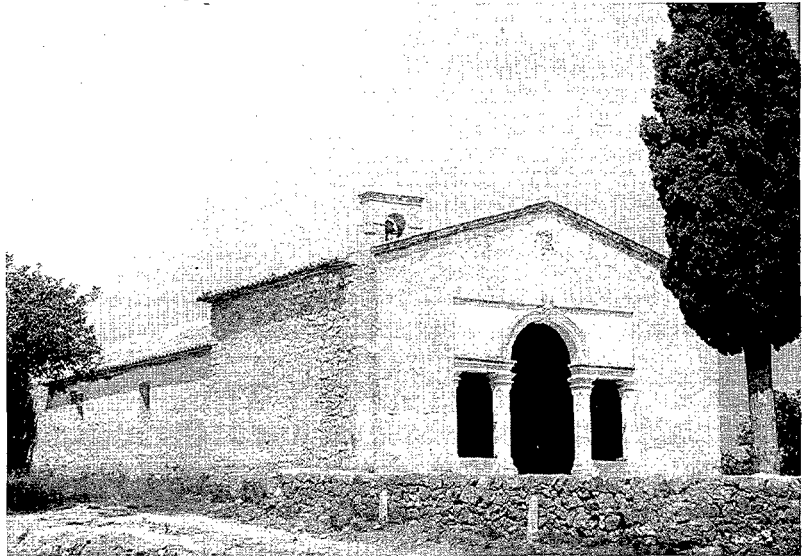
L'ermita de Sant Joan, de Dénia.

La Visita de l'any 1667 13 és l'última en que trobem menció a la confraria d'esclaus. Per tant la seua existència durà uns setanta anys, aproximadament en el període entre 1598 a 1670. A finals del segle XVII, pel 1671, ja no tenim notícies dels integrants de la confraria de Sant Joan, ja que encara que es parla de l'ermita ja no hi ha referències als confreres ni a la seua situació. Podem suposar que la confraria d'esclaus, "els negres", podia haver desaparegut per la manca d'esclaus a Dénia. No tenim moltes dades a aquest respecte, però revisant quasi al complet els llibres del segle XVIII de batejos i defuncions de l'església de l'Assumpció de Dénia, no arriben a deu, els esclaus que allí apareixen; òbviament, esclaus cristians, com els que integraven la confraria de sant Joan Baptista.