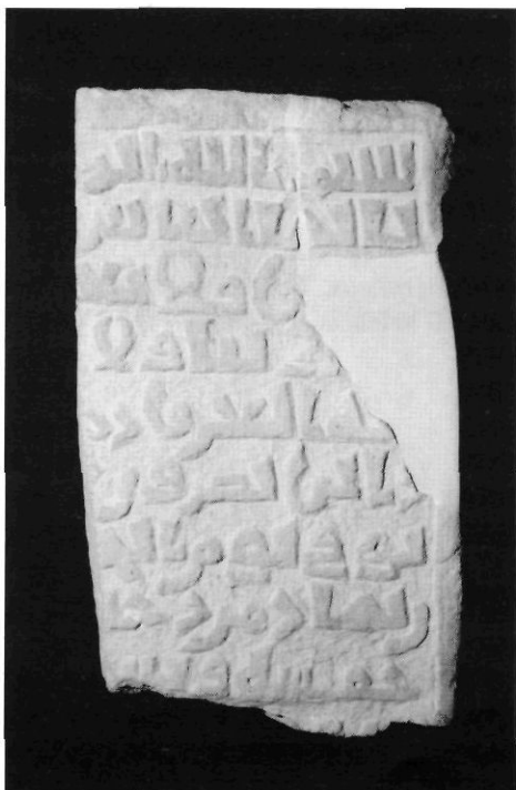
Fragment d'inscripció àrab de la Necròpolis de Cap de Martí conservada al Mvsev de Xàbia

Seguint C.Barceló, la data que figura en la inscripció és el 29 d'abril de 1199 (en una primera lectura, Barceló (1987) havia interpretat la data com del 29 de maig de 1199). Aquestes referències cronològiques ens permeten emmarcar l'ús de la necròpolis de Cap de Martí durant el segle XI-XII, amb dos cents anys d'ús.