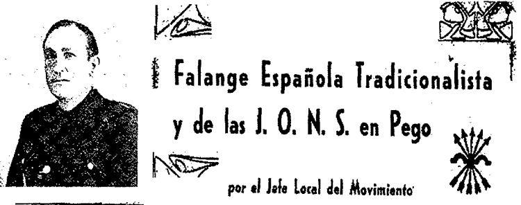
Llibre de festes de Pego, 1944.