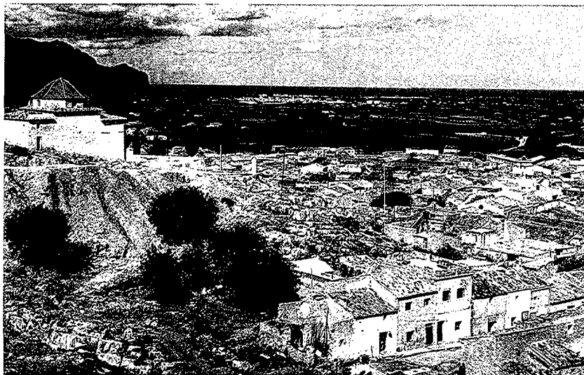
Vista general de Pedreguer.

tant, en assabentar-se del contingut dels decrets abolicionistes es negaren a continuar satisfent les prestacions feudals i iniciaren, com ja hem assenyalat abans, llargs i costosos plets que els tribunals fallaven generalment a favor dels senyors. Però com que els pobles ignoraven les sentències la noblesa va optar per la via de la concòrdia amb els emfiteutes. No obstant això, les pervivències es mantindran en altres àmbits de la vida ciutadana fins el segle XX. L'impost dels consums en seria l'exemple més paradigmàtic. 13