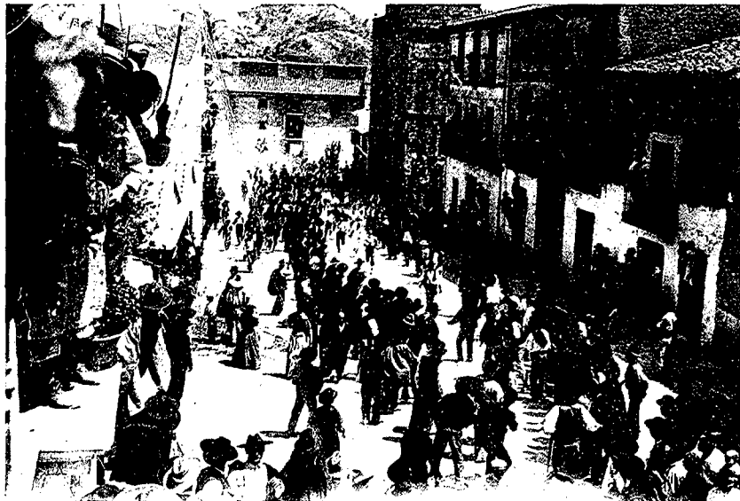
Carrera de galls a la plaça Major.