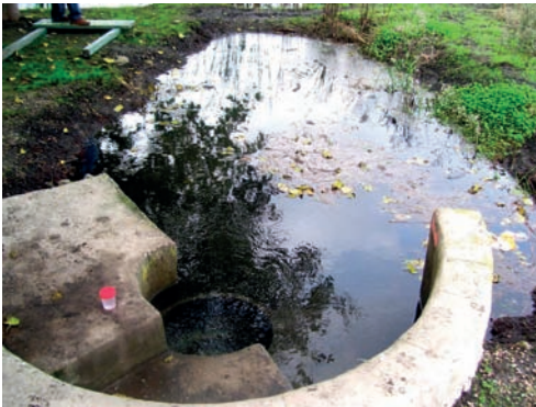
1. Ullal del Bullent.

Finalment cal destacar els valors atípics de l'Ullal del Burro, que com hem vist és el que més canvia. Açò, en part es deu a les pròpies qualitats de l'ullal (URIOS.1993), però en part pot ser degut a les fortes activitats antròpiques a que es troba sotmés aquest punt en concret, unes forces que actuen en detriment de la qualitat de les aigües (instal·lació d'un hotel en les seues proximitats, abundants turistes que hi naden per l'estiu...). Açò pot haver afectat a l'activitat fitoplantònica, l'augment de la qual podria explicar el pH tan baix d'aquesta zona: un excés de fotosíntesi retira \text{CO}_2 de l'aigua, desplaçant l'equilibri carbònic-carbonats cap a l'àcid carbònic, donant una baixada del pH (MARGALEF.1980).