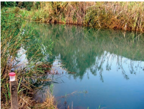
2. Blau Carapatar.