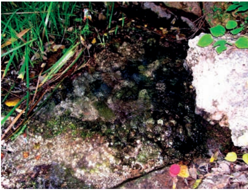
4. Les Aigües.