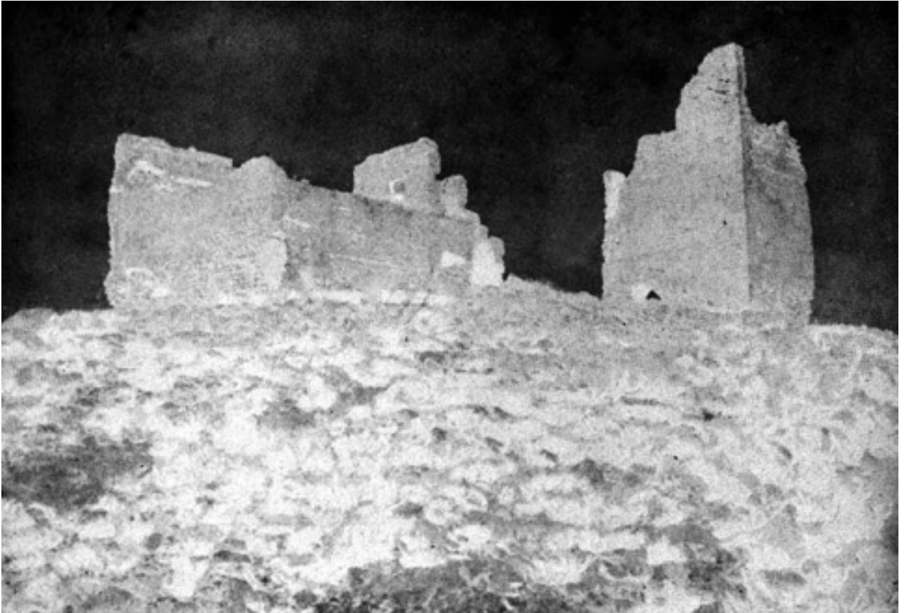
El palau d'Olimbroi, probablement en la dècada dels 10-20 del segle XX. Dènia 1881-1980.