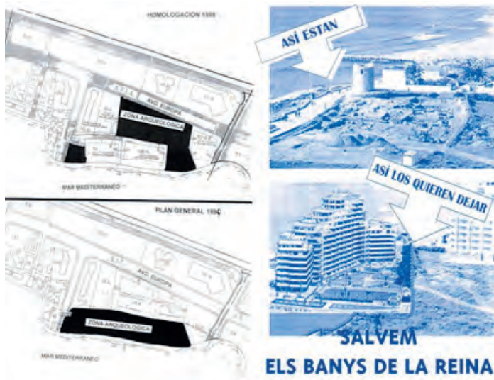
Comparativa del planejament urbà. Segona imatge: pamflets contra la construcció.

Prompte començarien els reclams dels col·lectius socials i culturals, encapçalats al seu moment per les Joventuts Socialistes i el Grup d'Opinió el Rotgale, que demanaven la protecció de tot el jaciment. Unes manifestacions que reclamaven de forma contundent la protecció integral del paratge, tant al consistori calpí, com a la pròpia Conselleria de Cultura.