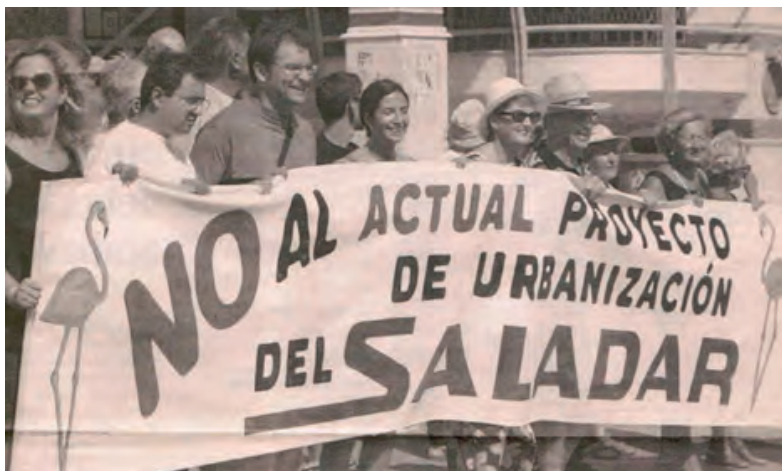
Manifestació per l'Avinguda Gabriel Miró per protegir les Salines.

En atenció a les postures dirigides cap a la protecció integral del paratge, destaca, sens dubte, el paper desenvolupat per l'Associació Cultural i Ecologista de Calp –ACEC-. Un grup que es va convertir en el moviment d'integració i acostament multicultural més efectiu que mai ha tingut aquest poble, doncs aglutinava alguns residents, població estrangera i ecologistes. També es comptaria amb el compromís i treballs mobilitzadors del grup de Benissa, el Runar. Després se li afegirien nombroses colles ecologistes i de residents europeus, que donarien la pertinent cobertura en forma de protestes i mobilitzacions. Més de 5.500 signatures, campanyes, invitacions a Eurodiputats per a visitar la zona, queixes formals i escrits, foren les tasques desenvolupades per aquests grups al llarg dels anys. Les queixes s'aglutinaven al voltant del propi impacte del sector urbanístic en les aus migratòries, la suposada contaminació d'aigües fecals, l'obertura de vials o la pròpia volumetria final dels edificis, que agredien el paisatge.