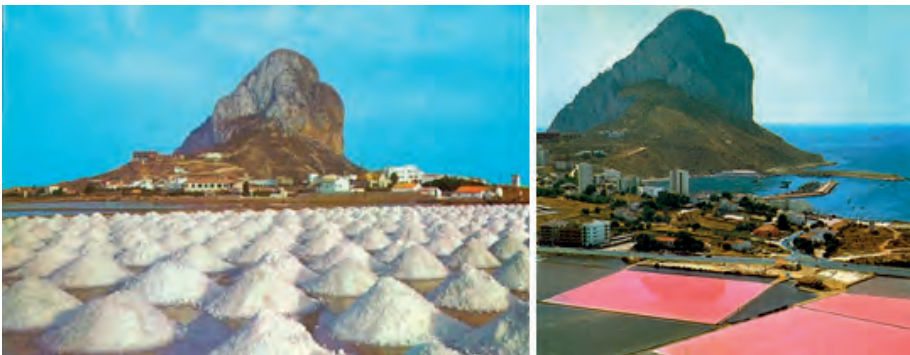
Salines en explotació (Font http://historiadecalp.net/ ).

Aquest paratge sempre ha sigut tema de debat i controvèrsia, especialment quan es tracta d'aclarir el valor cultural i ambiental que persones, col·lectius i administracions competents, li atorguen.