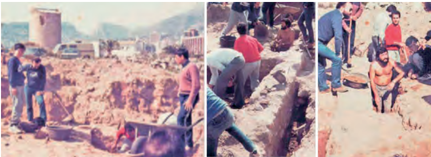
Excavacions realitzades pel grup de Calpins.

L'any 1983, un grup d'aficionats a l'arqueologia, la història i la cultura de Calp, s'encarregarien de pressionar al Director General del museu Arqueològic Provincial d'Alacant, per començar a excavar en l'entorn del Molí del Morelló. És en aquest moment, amb les primeres excavacions, quan començarien els primers conflictes seriosos entre els propietaris i el propi Ajuntament de Calp.