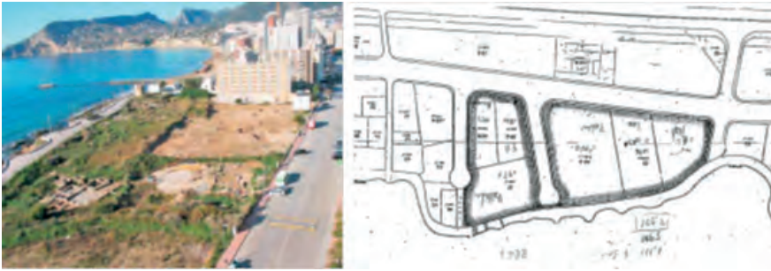
Emplaçament de les restes arqueològiques i parcel·les afectades pel PP núm.1.

El 10 de maig de 1978, s'acorda per unanimitat de les forces polítiques, protegir els Banys de la Reina, acotant una proposta geogràfica en relació amb l'àmbit inicial, i que després seria redefinida en un document que data de l'any 1981.