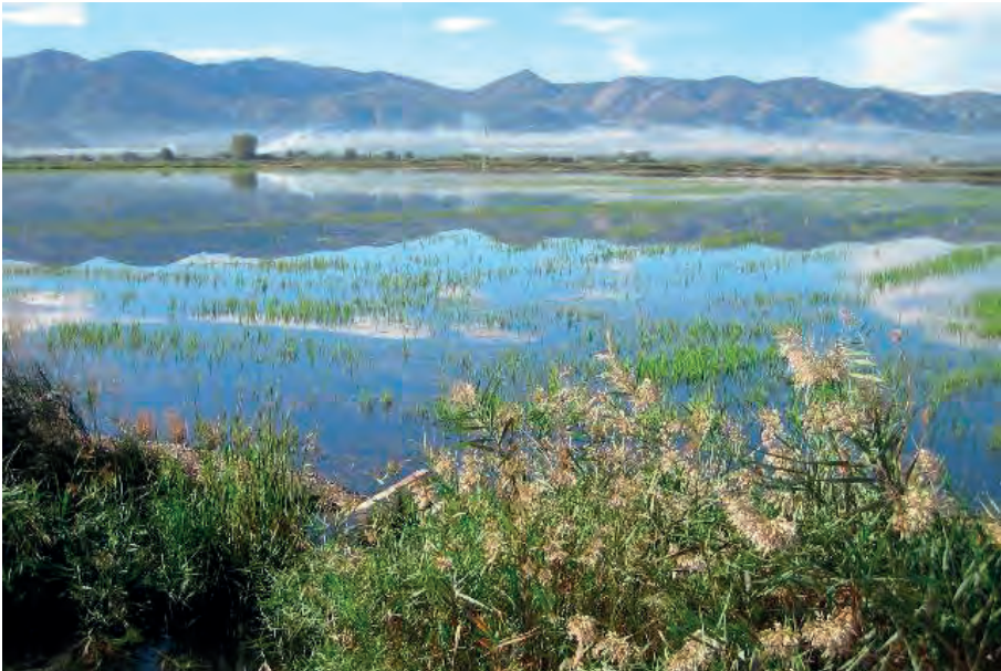
Parc natural de la Marjal de Pego-Oliva (Font GVA).

Font: Observacions sobre la Historia Natural, Geografia, Agricultura, Població i Fruits del Regne de València .