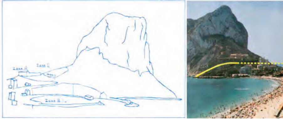
Primeres intencions de construcció -anys setanta i vuitanta-

el recolzament del Grup Pro-Defensa dels Interessos Turístics i Econòmics de Calp, representada per alguns promotors i agents immobiliaris, i que reunirien unes 900 signatures a favor de l'operació.