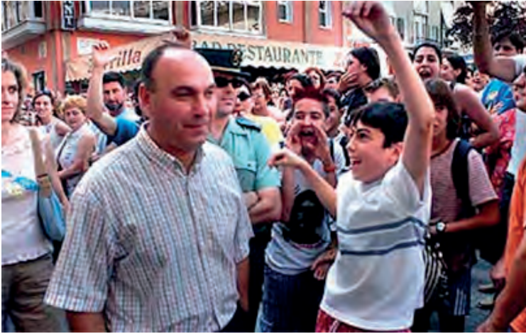
Part de la població local recolzava a l'alcalde processat per delictes ecològics.

Després de vuit anys de fortes polèmiques i conflictes, l'alcalde va perdre la majoria absoluta al maig de 2003, i l'oposició del PSPV, Bloc i PP signaren un pacte de govern que minvaria una mica el conflicte viscut anys enrere. De totes maneres, 18 anys després de la seua declaració com a Parc Natural, encara no s'ha aprovat el Pla Rector d'Ús i Gestió (PRUG). Els grups ecologistes s'han manifestat en nombroses ocasions per reivindicar-ho, arribant fins i tot al propi Síndic de Greuges de la Comunitat Valenciana.