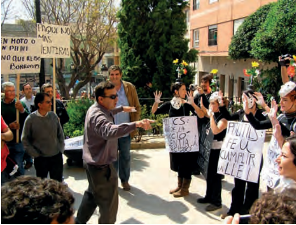
Ecologistes i constructors als baixos de l'Ajuntament de Dénia. Abril de 2005.

La polèmica entre constructors i l'Ajuntament arribaria al seu final a l'octubre de 2006, quan es signà un conveni per a la concessió de llicències 1 i s'aconseguí que la Confederació Hidrogràfica del Xúquer financera la construcció de la xarxa de clavegueram. L'execució d'aquestes obres començà a finals de 2011, encara que a dia d'avui no estan acabades, i han generat nombrosos conflictes i molèsties entre els veïns. De fet, l'Ajuntament de Dénia va denunciar a l'empresa adjudicatària de les obres.