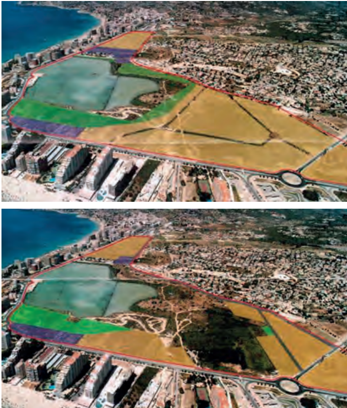
Comparativa dels Plans Generals 1995-1998 i que mostra més protecció d'espais a canvi de més edificabilitat.

Totes aquestes qüestions, generarien les conseqüents modificacions del propi Pla Parcial núm. 4 al llarg dels anys, sobretot en l'ajust i definició de les seues fites. En allò que es considera estrictament territorial, s'ha acabat per ampliar les superfícies no urbanitzables, passant dels 297.000 m 2 del planejament urbà dels anys 1989 i 1995, fins als 395.000 m 2 de superfície protegida en l'Homologació del Pla General de 1998. Una ampliació de proteccions, a canvi d'atorgar majors edificabilitats als perímetres del sector.