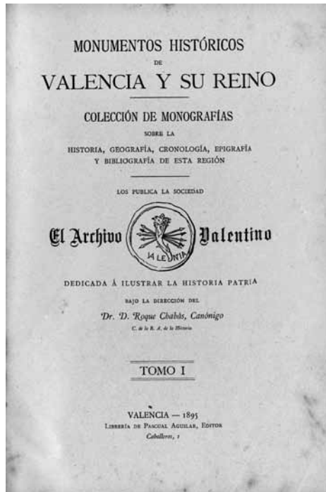
Any 1895. Monumentos històrics de Valencia y su Reino. Arxiu Municipal de Dènia. Biblioteca històrica.

Mañana concluyo la compulsa del Ms. Roig y estoy satisfecho del resultado. Queda por llenar una laguna que copiaré mañana o el viernes y con esto se redondea Jaume Roig. Muchísimas dificultades de interpretación con erratas de imprenta, por más que aún quedará mucho que estudiar para comprender el sentido de las frases ocultas, si bien se reducen mucho. 35