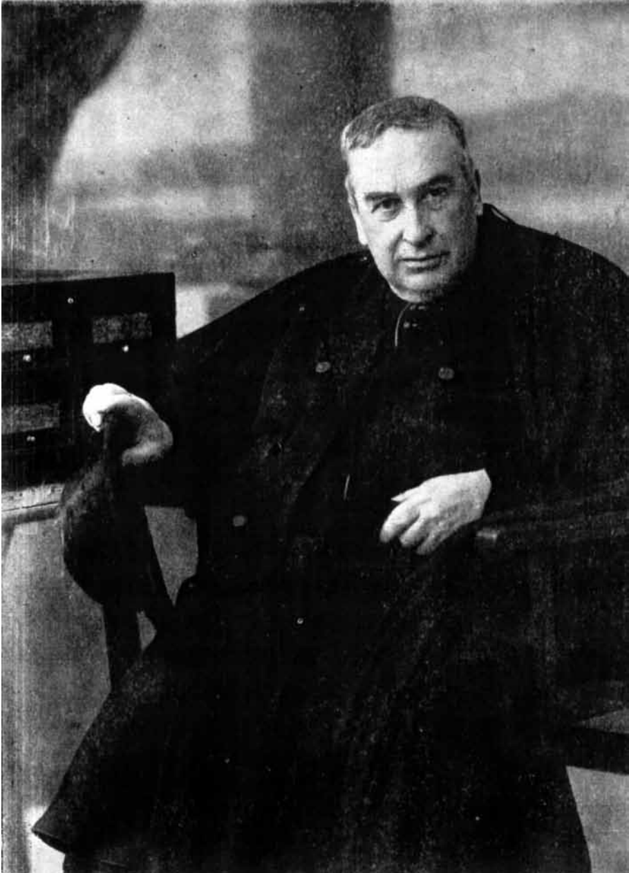
Roc Chabàs. Arxiu Municipal de Dénia. Fons gràfic.

revisà els documents i così i enquadernà allò que de més valuós va trobar i el que més va utilitzar, un treball amb una finalitat utilitària però també amb un objectiu primordial: facilitar la seua conservació. Roc Chabàs, en aquells anys de residència a Dénia,